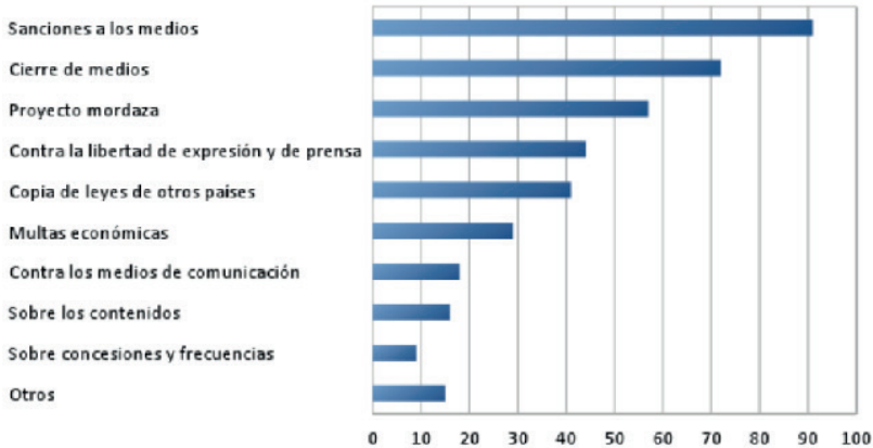
Figura 2. Distribución de los principales temas discutidos sobre Proyecto de Ley de Radio y Televisión presentada por el Gobierno. 2016.

detrimento, violación, menosprecio, amenaza, controlar, limitar, cercenar, socavar o restringir, contra la libertad de expresión y de prensa. Los medios en donde se mencionó este tema fueron: Canal 7, Canal 6, Diario Extra, El Financiero, La Nación, Semanario Universidad, CR-Hoy, Informa-TICO.com, Panorama/CANARA.